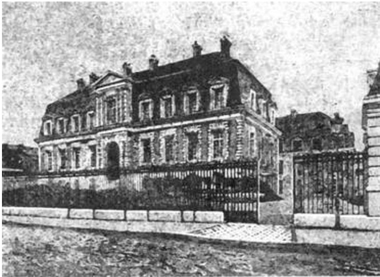
Здание Пастеровского института в Париже.

Мы имеем в виду историю постройки Пастеровского института.