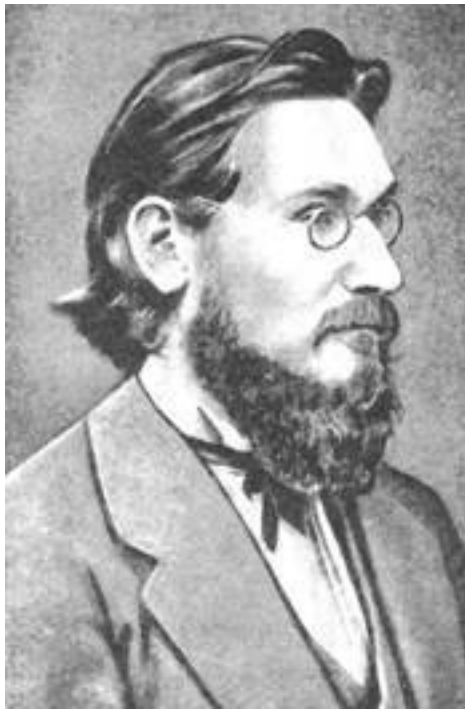
И. И. Мечников.

Последние пять лет окончательно “доехали” его. Годы, болезнь, от которой он не оправлялся вполне со времени исследования над пембриной, работа, слишком утомительная для больного старика, нравственные потрясения, тревога, сомнения, опасения, сознание страшной ответственности, бессонные ночи и беспокойные дни, зрелище ран, страданий, иску-