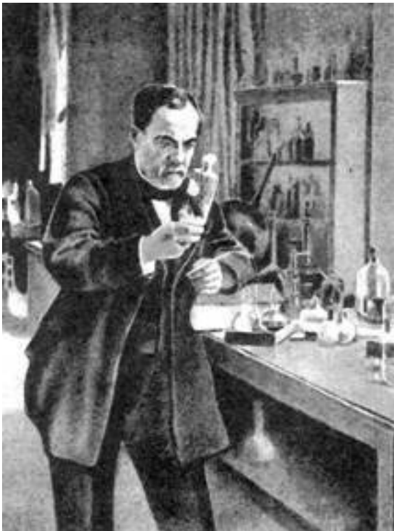
Луи Пастер в лаборатории.

Лаборатория Пастера значительно расширилась; ему отделили дополнительную пристройку, где была развернута бактериологическая станция.