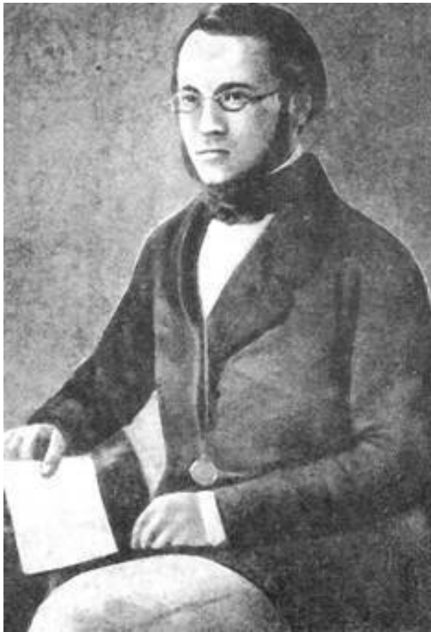
Луи Пастер в возрасте 28 лет. Год профессорства в Страсбурге.