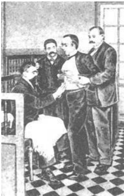
Прививка пастеровской вакцины.

Пастер искал, и нашел, и доказал опытами, что прививка этого микроба вызывает у животных болезнь и смерть, как в опытах Жальера и Лепла.