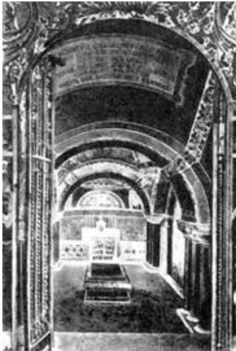
Гробница Пастера в Пастеровском институте.