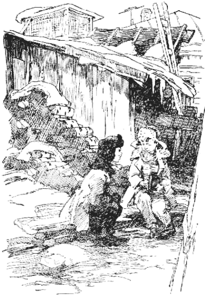
Иногда сидят на старом Боровом и смотрят в банку с темными каштановыми вареньями.

– Ешь, чего ты, – сказал Яшка. – Сам же хотел варенья!