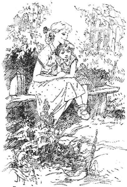
Насажда уютно прижалась к Зине, и сказка началась.