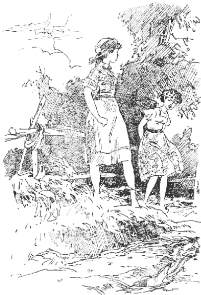
Только осенью было ударить Лягу.

Она глядела на свои нежные руки, на ладони, почерневшие от травы, на заусенцы, которые появились около розовых ногтей, и слезы текли у нее по щекам.