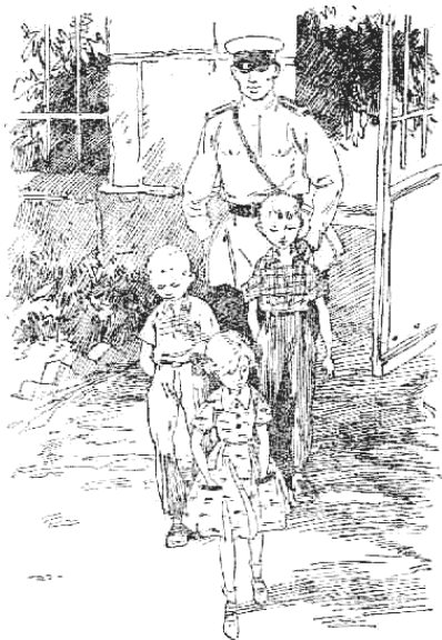
Робота выполнена Марьямкой и Вассерманом.

– И чтобы люди уток не трогали и не пугали. И пруд этот для уток сделан, а не для людей. Большой парень, а понадеяться на тебя никак нельзя. Как же это так? А?