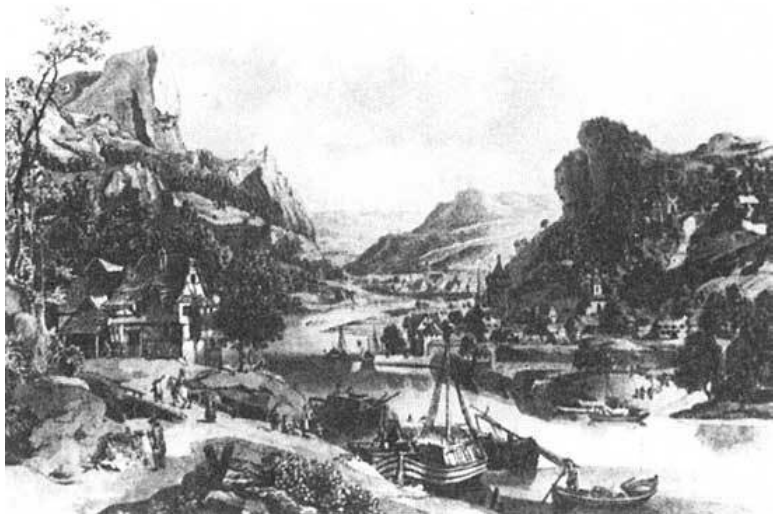
На Рейне. Акватинта Г.-И. Шютца. Начало 19 в.