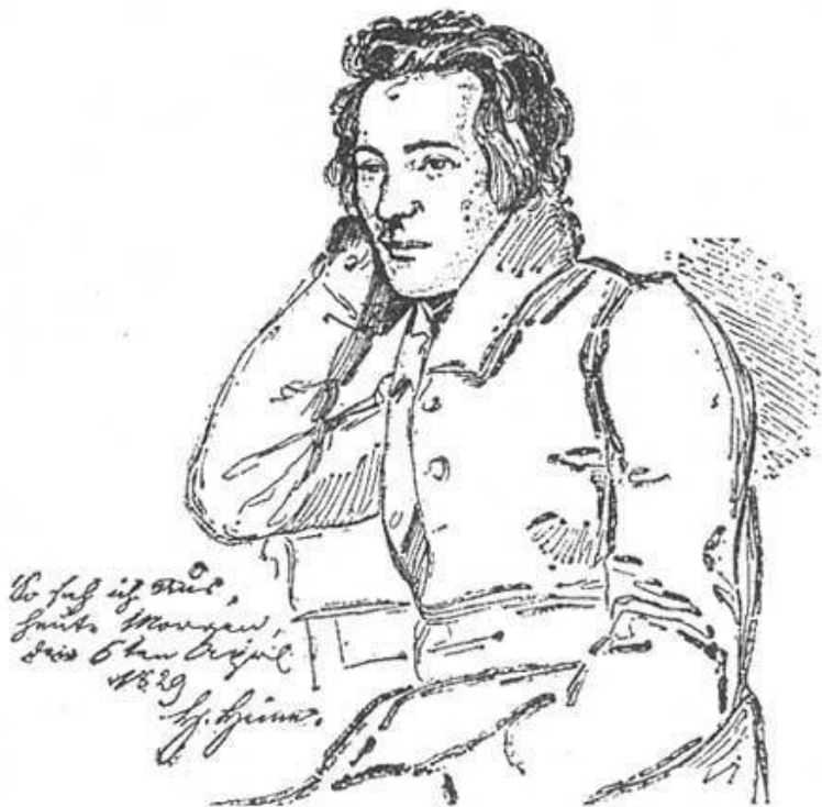
Г. Гейне на 30-м году жизни. С рисунка Ф. Куглера