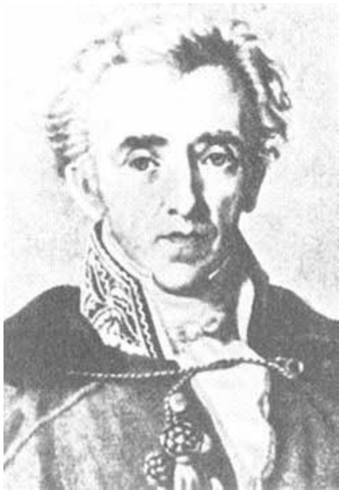
Иоганн Фридрих фон Котта, издатель.