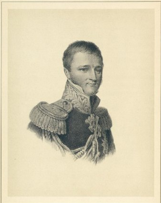
Князь Михаил Семёнович Воронцовъ (1782—1856)

Prince Michel Semenowitch Worontzoff (1782—1856)