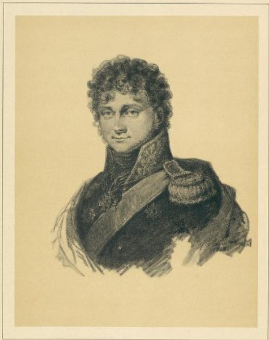
Граф Павел Александрович Строгановъ (1774—1817) Comte Paul Alexandrovitch Stroganoff (1774—1817).