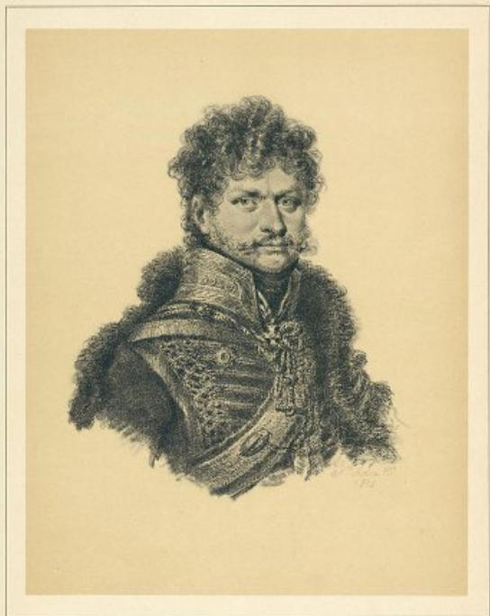
Князь Елизаръ-Васильевичъ Василъчинскій (1777—1847) Prince Elzior Vasilevitch Wassilichineff (1777—1847)