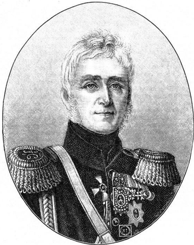
Генерал-фельдмаршал М.С. Воронцов