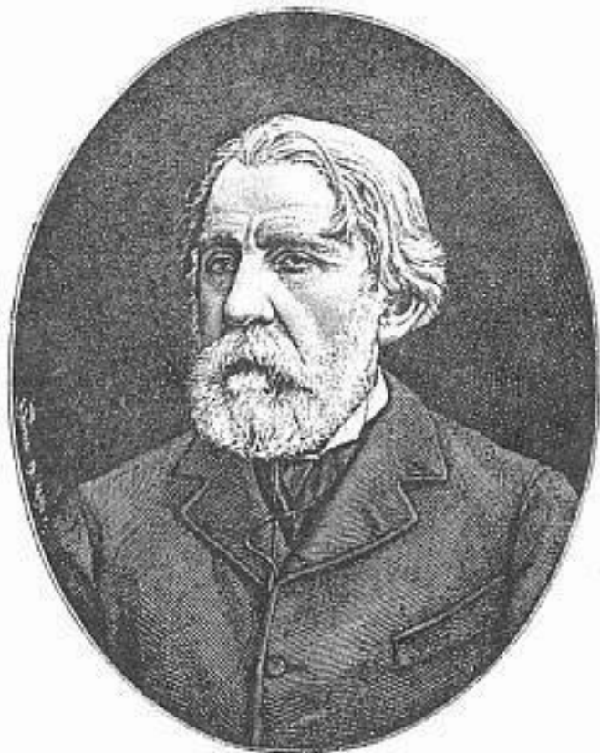
W. W. F. F. F.