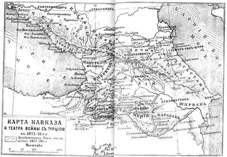
Карта Кавказа и театра войны с Турцией в 1877-78 гг.