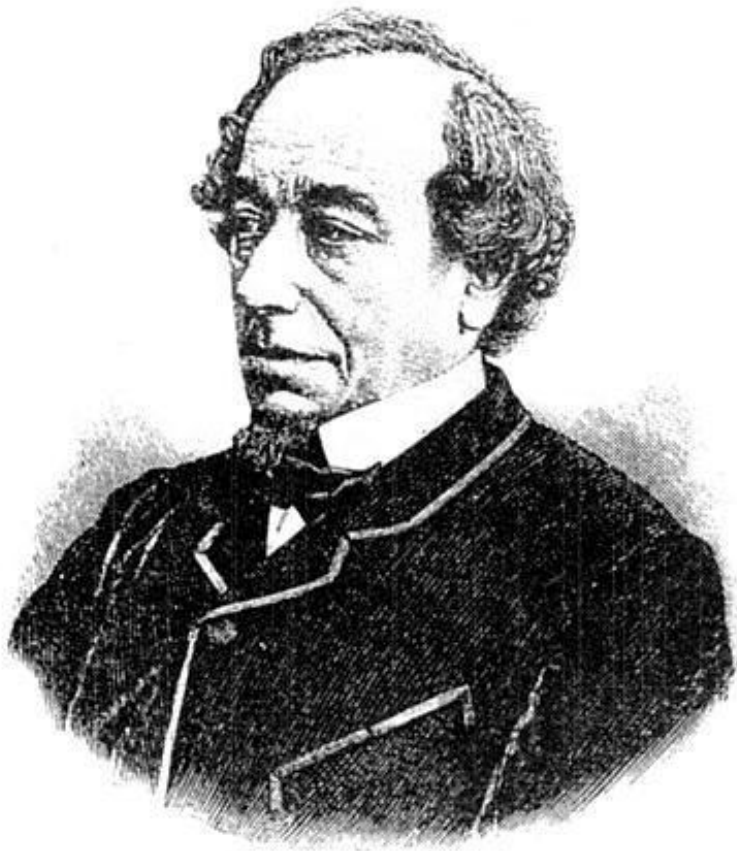
Бенджамин Дизраэли, лорд Биконсфильд