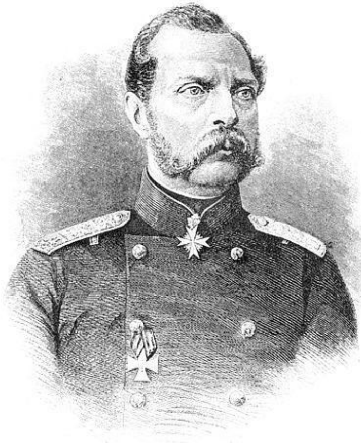
Александр II, император Всероссийский

По несчастью, главная атака была направлена как раз против Скобелева.