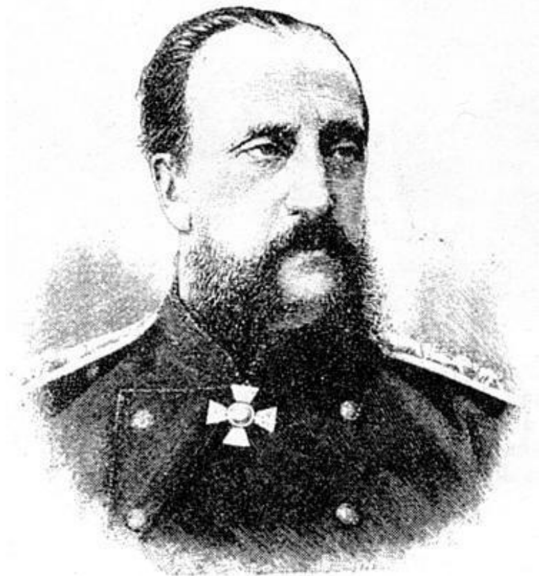
Великий князь Николай Николаевич