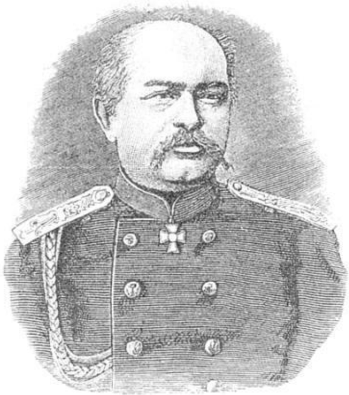
Свиты Его Величества генерал-майор Михаил Иванович Драгомиров

В ночь переправы, после второго рейса наших лодок, Скобелев отправился на тот берег вместе с Драгомировым, шта-