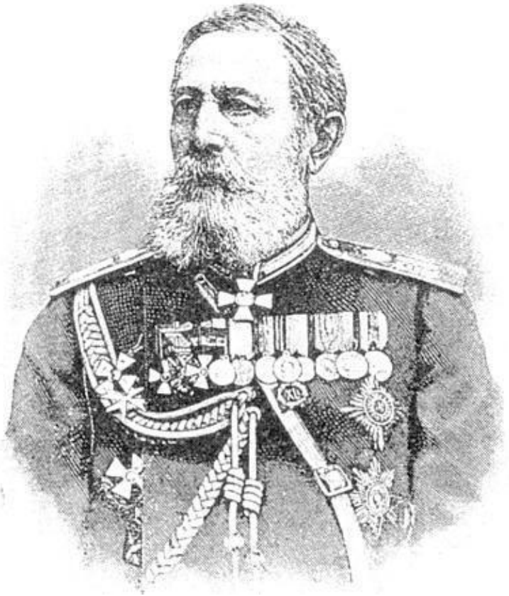
Генерал-адъютант Ф. Ф. Радецкий

23 декабря Скобелев, снесшись с Радецким, движется на селение Шипку. Инициатива атаки с фланга и с тыла была