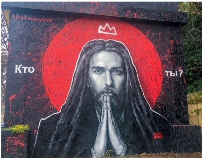
Граффити в Сочи.