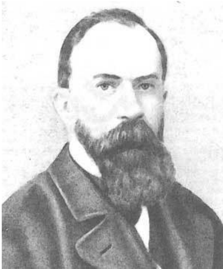
Владимир Онуфриевич Ковалевский.