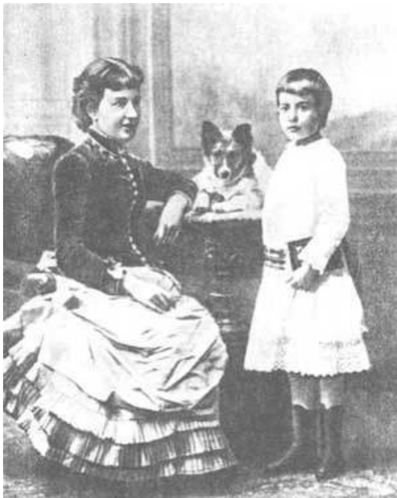
Софья Ковалевская с дочерью Соней.