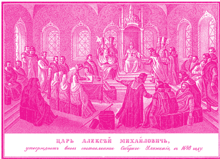
ЦАРЬ АЛЕКСЕЙ МИХАЙЛОВИЧ, утверждает вновь составленное Соборное Уложение, в 1648 году.