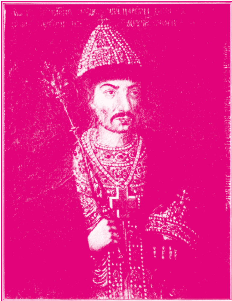
Царь Борис Феодорович Годунов