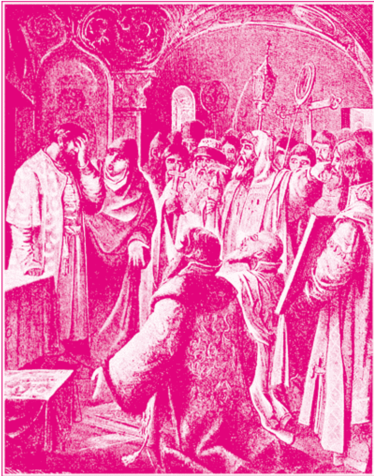
В. Медведев. Патриарх Иов и московский народ просят Бориса Годунова на царство