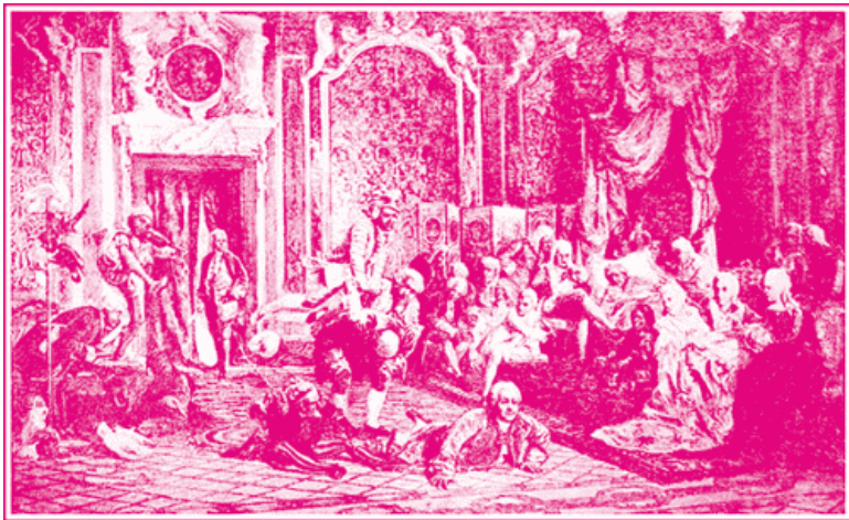
В. Якоби. Шуты при дворе Анны Иоанновны

ства, оскорбленного господством иноземцев: врывались в дома, где жили немцы, и порядочно помяли даже канцлера Остермана и самого фельдмаршала Миниха. Гвардейские офицеры потребовали у новой императрицы, чтобы она изгнала Россию от немецкого ига. Она дала отставку некоторым немцам. Гвардия осталась недовольна, требуя поголовного изгнания всех немцев за границу. В Финляндском походе (тогда шла война со Швецией) в лагере под Выборгом против немцев поднялся открытый бунт гвардии, усмирный только благодаря энергии генерала Кейта, который, схватив первого попавшегося бунтовщика, приказал сейчас же позвать священника, чтобы приготовить солдата к расстрелянию.