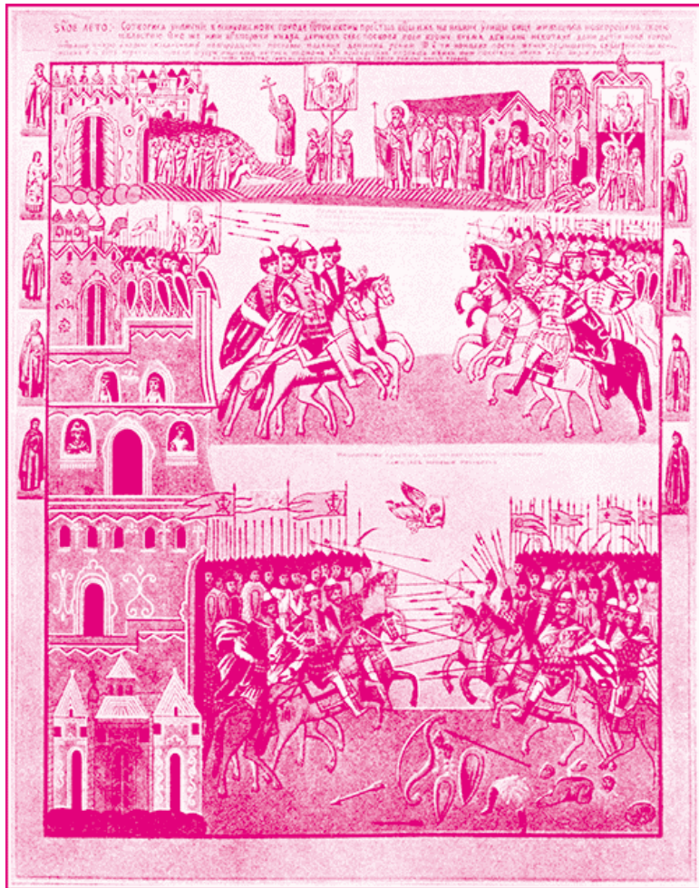
Древняя икона с изображением преславного чуда Знамени Божией Матери