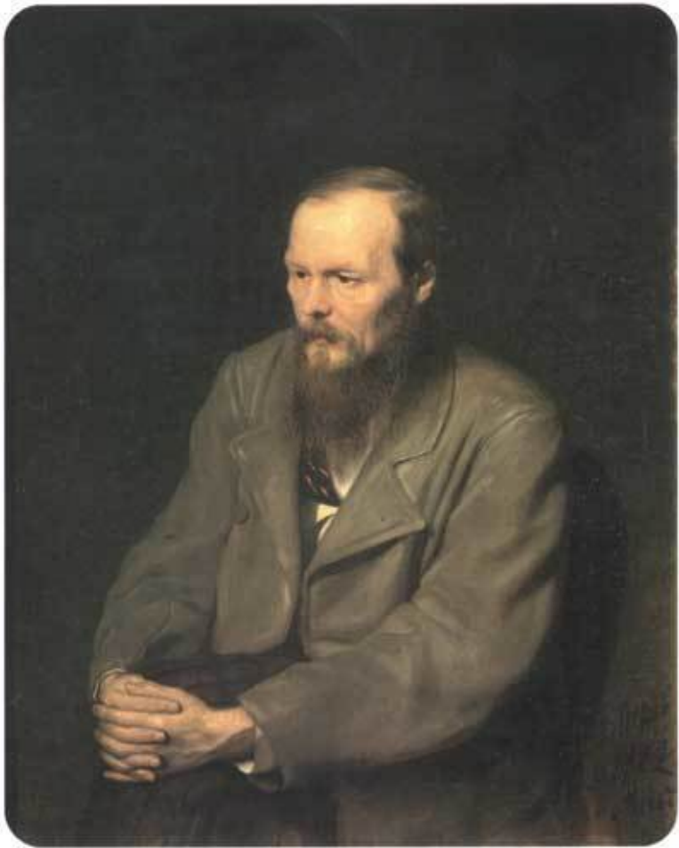
Перов В. Г. Портрет Ф. М. Достоевского. 1872 г.