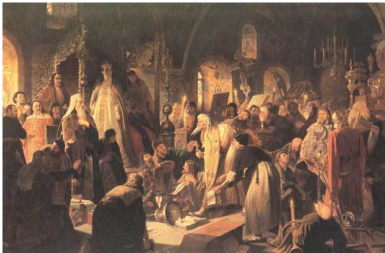
Перов В. Г. Никита Пустосвят. Спор о вере. 1880—

лове суздальского митрополита Афанасия, упавшего навзничь на ступеньки трона, наступает на патриарха со сжатыми кулаками. Его (фигура одна достойна целой картины; во всей русской живописи нельзя найти другой, подобной ей, где бы так поразительно верно разгадан был характер этого фанатика раскола. Кругом него толпа раскольников, пришедшая с ним защищать общее дело. Она состоит из всевозможных типов, различно выражающих свое сочувствие поступку Никиты, бросающихся избавить его от насевших стрельцов. Картина полна движения и драматизма.