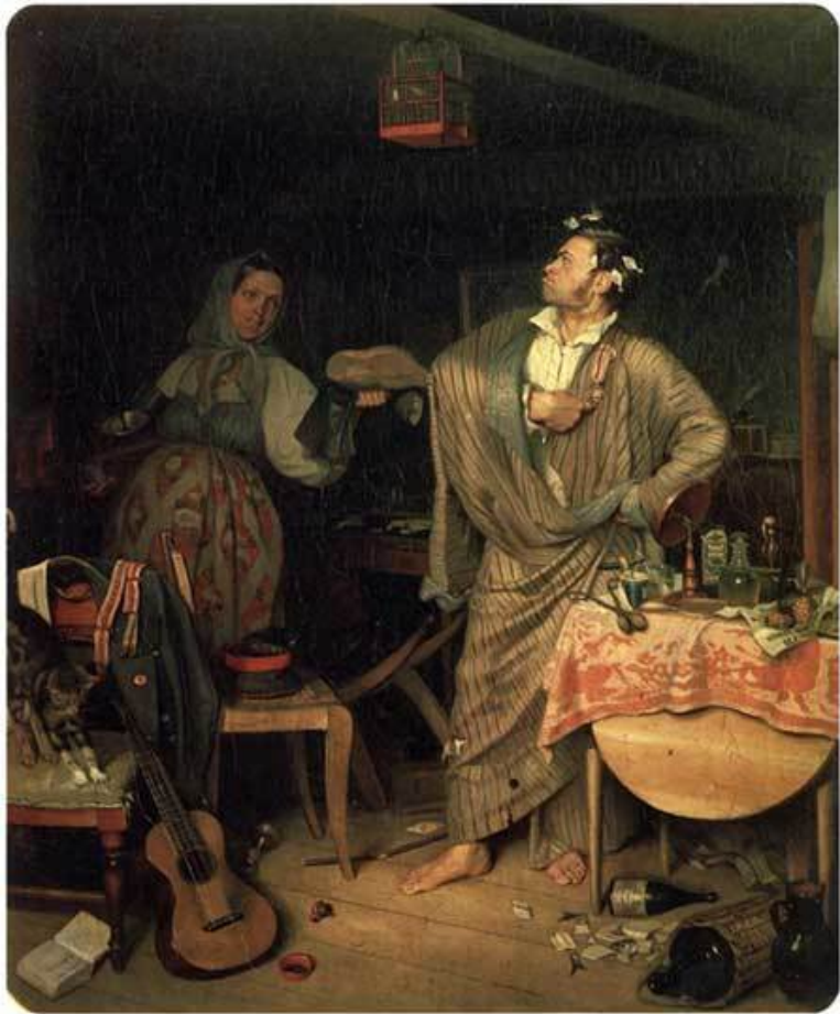
Федотов П.А. «Свежий кавалер, или Утро чиновника, получившего первый орден» 1846