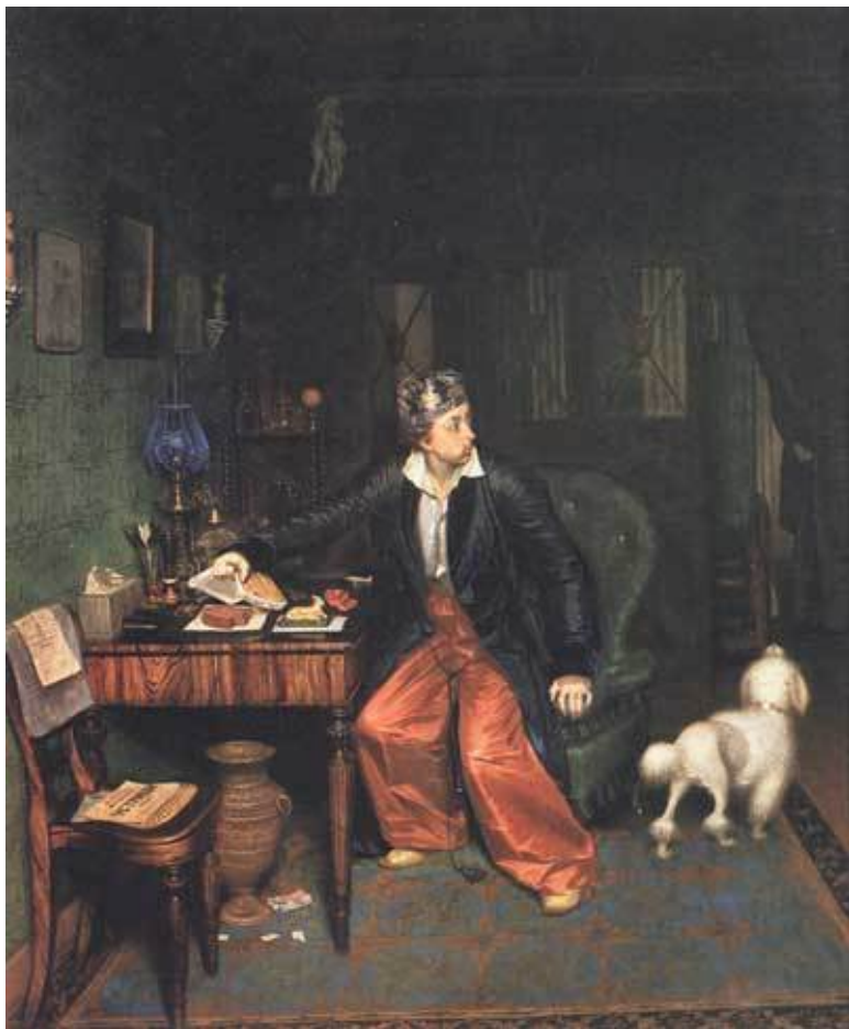
Федотов П.А. Не в пору гость (Завтрак аристократа). 1849—1850. Фрагмент