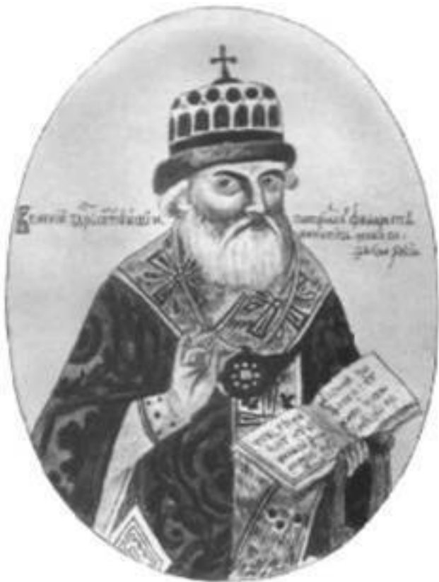
Боярин Федор Никитич Романов

смерть от рук «благодарных» соотечественников.