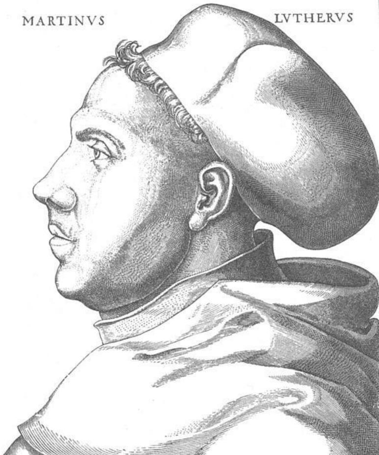
Мартин Лютер, 38 лет, в одежде августинского монаха. По гравюре Л. Кранаха, 1521 г.