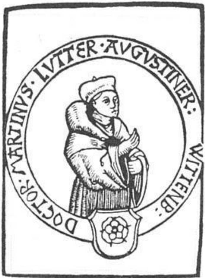
Доктор Мартинус Лютер, августинец. Старейшее из из-