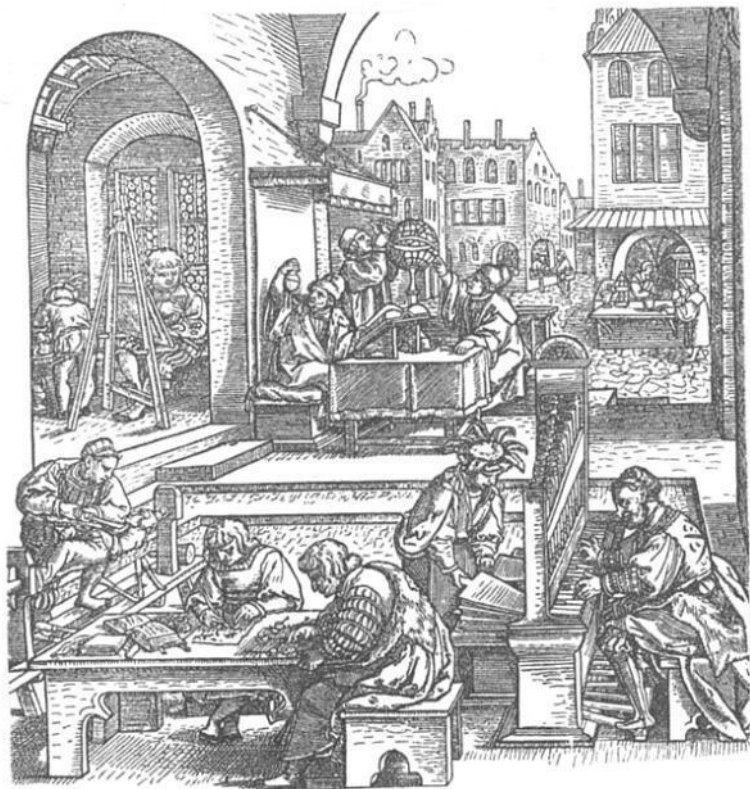
Городская жизнь в Германии в первой половине XVI в. Фрагмент гравюры Ганса Зебальда Бэгама

Результаты этой системы более или менее известны. Продажа должностей повлекла за собой порчу высшей иерархии.