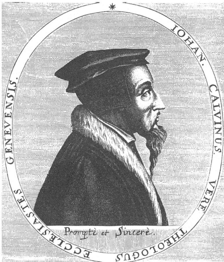
Жан Кальвин. С гравюры неизвестного автора

Но и эта попытка окончилась неудачей. Весть об их возвращении вызвала в Женеве настоящий взрыв народной ярости.