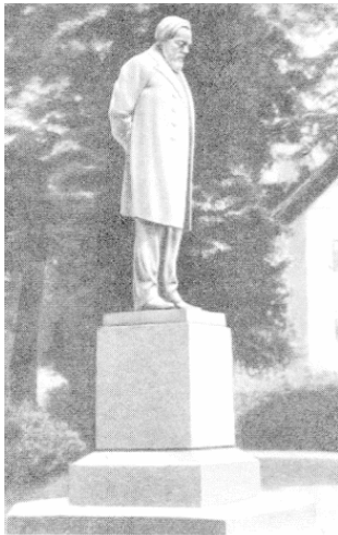
Памятник С. П. Боткину перед клиникой, в которой он работал. Скульптор В. А. Беклемишев. Бронза. Петербург. Открыт в 1908 году.

В клинике сосредоточилась вся его страсть к науке и именно самая благородная сторона знаний – применение их к жизни; от клиники он получал двойное удовлетворение. Во-первых, в ней он продолжал учиться сам, проверяя все, что ему давали как книга, так и те соображения и задачи, которые зарождались, вырабатывались и в несметном количе-