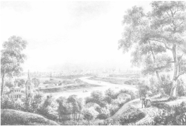
Москва.1825 год. Вид с Воробьёвых гор. Художник С. Кадель.