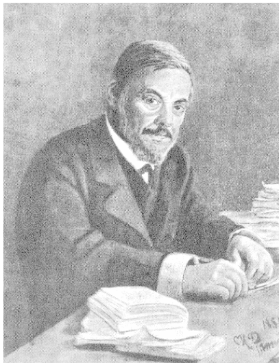
Иван Михайлович Сеченов. И. Е. Репин. Масло. 1859.